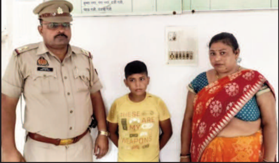
दिल्ली क्षेत्र के गांव ओमनगर वर्षीय किशोर मां की डांट से आया। रेलवे स्टेशन पर

शिकोहाबाद। बदरपुर नई मीठापुर निवासी एक 12 क्षुब्ध होकर दिल्ली से भाग